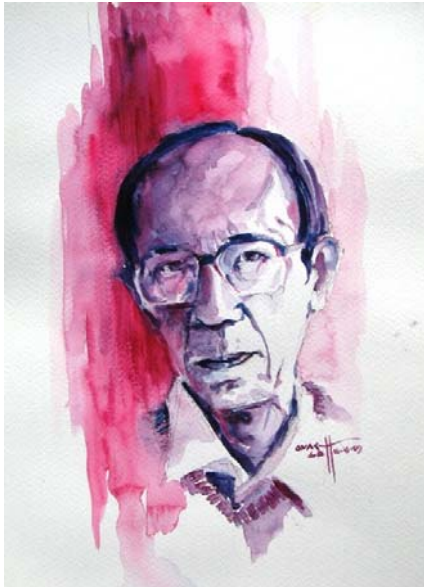
ဆရာ မြသန်းတင့်

"... ... ရင်ဆိုင်ရတဲ့ ရန်သူရဲ့အနေအထား၊ ဖြတ်သန်းရတဲ့ ခေတ်ကာလ အခြေအနေတွေနဲ့ နှိုင်းယှဉ်ပြောရရင်တော့ သမီးလုပ်တဲ့ ဒေါ်အောင်ဆန်းစုကြည်က ဖအေဖြစ်တဲ့ ဗိုလ်ချုပ်အောင်ဆန်းထက် ပိုပြီး တော်တယ်လို့ ကျနော် သတ်မှတ်ချင်ပါတယ် ... .."