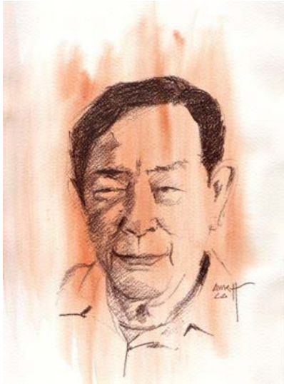
ရုပ်ရှင်မင်းသားကြီး ထွန်းဝေ

တိုင်းပြည်တပြည်၊ လူမျိုးတမျိုးရဲ့ ဘဝမှာ စာပေနဲ့ အနုပညာဟာ ဘယ်အခန်းကဏ္ဍက ပါဝင်သလဲ။ ဘယ်လို အနေ အထားမှာ ရှိသလဲ။