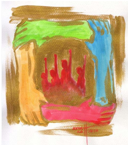
(သရုပ်ဖော် အောင်လတ်)

ခေတ်တွေ ဘယ်လိုပြောင်းပြောင်း နိုင်းမြစ်ကြီးကတော့ စီးမြုပ်ပဲတဲ့။ ဆရာ ဦးသိန်းဖေမြင့် ပြောခဲ့တဲ့ စကားကို ပြန်သတိ ရမိပါတယ်။ ကျနော်တို့ရဲ့ ဧရာဝတီမြစ်ကြီးကလည်း ဒီအတိုင်းပါပဲ။ ကျနော်တို့ ပြည်သူတွေရဲ့ စစ်အာဏာရှင် စနစ် ဆန့်ကျင်ဖြုတ်ချရေး၊ ဒီမိုကရေစီနဲ့ လူ့အခွင့်အရေး ရရှိရေး တိုက်ပွဲဝင် စိတ်ဓာတ်တွေလည်း တသွင်သွင် စီးဆင်းနေဆဲ ပဲ မဟုတ်ပါလား။