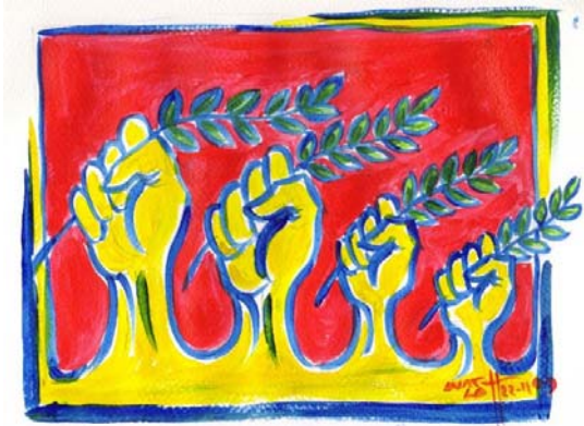
(ပန်းချီ အောင်လတ်)

နိုဝင်ဘာက သမိုင်းဖြစ်ရပ်တွေနဲ့ ဆက်စပ်ပတ်သက်နေတဲ့ ဥပဒေဆိုင်ရာ စကားတစ်ခုနဲ့ ရှိပါတယ်။ အဲဒီစကားကတော့ "ခေတ်တခေတ်မှာ အဲဒီခေတ်နဲ့ ကိုက်ညီတဲ့ ရာဇဝတ်ကောင်ဆိုတာ အမြဲရှိတယ်" ဆိုတဲ့ စကားပါပဲ။