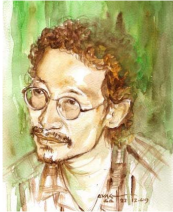
ထူးအိမ်သင် (သရုပ်ဖော် ပန်းချီ - အောင်လတ်)

"... ထူးအိမ်သင် တောထဲမှာ ရေးစပ်ခဲ့တဲ့ အရေးကြီးပြီး ညီနောင်အပေါင်းတို့၊ သွေးစည်းကာ ညီစေညီကြစို့ ဆိုတဲ့ အဆုံးသတ်တိုက်ပွဲ သီချင်းကို ..."