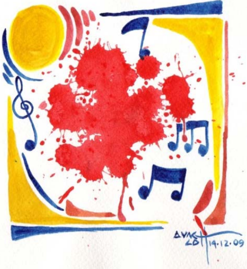
(သရုပ်ဖော် ပန်းချီ - အောင်လတ်)

တော်လှန်ရေးနဲ့ အနုပညာ။ တော်လှန်ရေး အနုပညာဆိုပါတော့။ ဗိုလ်ချုပ်အောင်ဆန်း ပြောခဲ့ဖူးတဲ့ စကားရှိတယ်။ "တော်လှန်ရေးမှာ အနုပညာ ပါရမယ်။ အနုပညာ မပါတဲ့ တော်လှန်ရေးဟာ မအောင်မြင်နိုင်ဘူး" တဲ့။