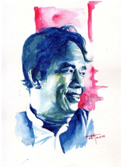
ရှစ်ရှင်မင်းသားကြီး မြတ်လေး

ကျနော် ကဗျာဆရာတယောက်ပါ။ "မဆလခေတ်တုန်းက ကဗျာဆရာတယောက်ဟာ စင်ပြိုင်အစိုးရ တရပ်ဖြစ်တယ်" ဆိုတဲ့ ရုရှားကဗျာဆရာ ယက်ဖီတူရှင်ကဲ့ရဲ့ စကားနဲ့ ကျနော်တို့ ဖြတ်သန်းလာခဲ့ကြတယ်။