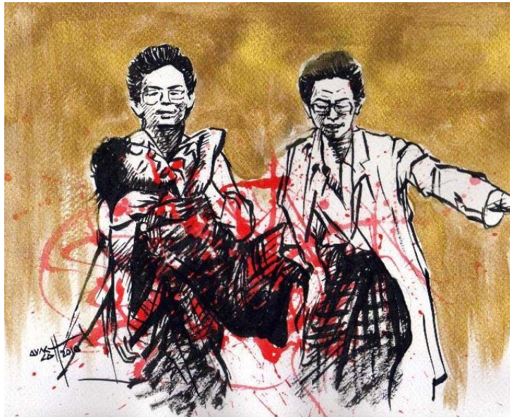
(သရုပ်ဖော် - အောင်လတ်)

ဒီနေ့ခေတ်ကို သတင်းနည်းပညာခေတ်လို့ ဆိုကြပါတယ်။ ဘာသာရပ် ဝေါဟာရအားဖြင့် သတင်းဆက်သွယ်ရေး နည်းပညာ Information Communication Technology (ICT) လို့ ခေါ်ပါတယ်။