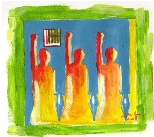
(ပန်းချီ အောင်လတ်)