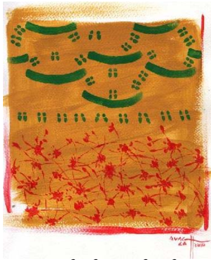
(သရုပ်ဖော် - အောင်လတ်)

ပန်းဆိုတာ ကြွေမှာပဲလေ။ တပွင့်ကြွေရင် နှစ်ပွင့်ဝေမယ်၊ ကြွေတာကိုက ပွင့်ခြင်းပဲ။ ကွယ်လွန်သူ ကဗျာဆရာ မောင်ချောနွယ် ၁၉၆၉ ခုနှစ်တုန်းက တော်လှန်ကဗျာစာအုပ်ထဲမှာ ရေးခဲ့တဲ့ ကဗျာ တပိုဒ်ပါ။