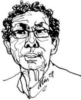
စာရေးသူ ကဗျာဆရာ အောင်ဝေး

ရှစ်လေးလုံး အရေးတော်ပုံကြီး ပြီးစ မြန်မာ့နိုင်ငံရေး အခြေအနေနဲ့ ပတ်သက်လို့ ကျနော်တို့ ခေါင်းဆောင် ဒေါ်အောင်ဆန်းစုကြည် ပြောခဲ့ဖူးတဲ့ စကားတစ်ခွန်းက အင်မတန် အလင်္ကာ ဆန်လှပါတယ်။