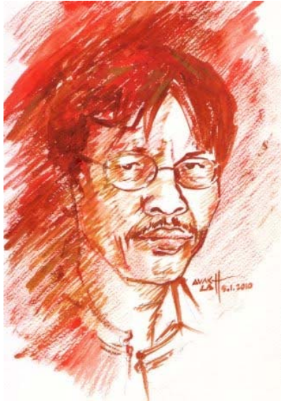
စိုင်းထီးဆိုင် (သရုပ်ဖော် ပန်းချီ - အောင်လတ်)

ကျွန်တော်တို့ တိုင်းပြည်ဟာ တိုင်းရင်းသားလူမျိုးပေါင်းစုံနဲ့ ဖွဲ့စည်းထားတဲ့ ပြည်ထောင်စု တိုင်းပြည် ဖြစ်တယ်။ မြန်မာ့ နိုင်ငံရေးဟာ တိုင်းရင်းသားနိုင်ငံရေး ဖြစ်တယ်လို့ ပြောရပါမယ်။ တိုင်းရင်းသားအရေးဟာ ကျနော်တို့ရဲ့ အမျိုးသား အရေးပဲ မဟုတ်လား။