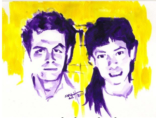
(သရုပ်ဖော် အောင်လတ်)

ကျနော်ပြောရင် ယုံချင်မှ ယုံကြလိမ့်မယ်။ ကျနော်တို့ တိုင်းပြည်မှာ အတိုက်အခံ နိုင်ငံရေး လှုပ်ရှားသူတွေ အစိုးရ မကြိုက်တဲ့ နိုင်ငံရေးသမားတွေ စာရေးသားခွင့် မရကြပါဘူး။ အထူးသဖြင့် အဲန်အယ်လ်ဒီ (NLD) အဖွဲ့ဝင်တွေ စာရေးခွင့် မရှိပါဘူး။