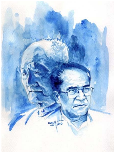
ကိုလေး (အင်းဝဂုဏ်ရည်) နှင့် ကြည်အောင် (သရုပ်ဖော်-အောင်လတ်)

ကျနော်တို့ ခေါင်းဆောင် ဒေါ်အောင်ဆန်းစုကြည်ဟာ သူ့ ဖခင် ဗိုလ်ချုပ်အောင်ဆန်းလိုပဲ မြန်မာစာပေ အနုပညာနဲ့ ကင်းကွာတဲ့သူတယောက် မဟုတ်ပါဘူး။ တိုင်းတပါးမှာ အခြေအနေအရ အနေကြာခဲ့ပေမဲ့ ဒေါ်အောင်ဆန်းစုကြည်ဟာ မြန်မာစာပေ၊ မြန်မာ အနုပညာတွေကို မပြတ်လေ့လာ ဆည်းပူးနိုင်ခဲ့တဲ့သူပါ။ နိုင်ငံခြားရောက်နေပေမဲ့ မြန်မာ့ ယဉ်ကျေးမှု၊ မြန်မာ့နိုင်ငံရေးနဲ့ ဘယ်တုန်းကမှ မျက်ခြည်မပြတ်ခဲ့တဲ့သူပါပဲ။