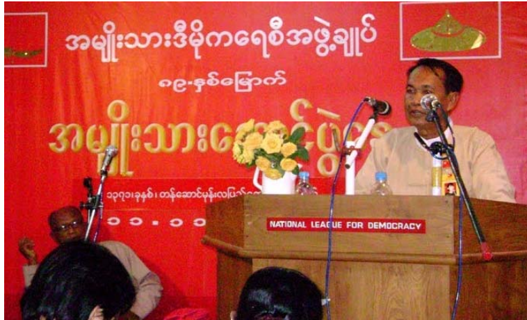
ကဗျာဆရာ မုံရွာအောင်ရှင်

အခုတလော မြန်မာနိုင်ငံ အကျဉ်းထောင် အသီးသီးထဲက ပြန်လွတ်လာတဲ့ နိုင်ငံရေးအကျဉ်းသားတွေထဲမှာ ကျနော်တို့ရဲ့ ရဲဘော်ကြီး ကဗျာဆရာ မုံရွာအောင်ရှင်လည်း အင်းစိန်ထောင်ကနေ ပြန်ထွက်လာပါတယ်။ ဆရာ မုံရွာအောင်ရှင်ကို စစ်အစိုးရက ၂၀၀၀ ပြည့်နှစ်မှာ ပုံနှိပ် အက်ဥပဒေတွေနဲ့ ထောင်ဒဏ် ၂၁ နှစ် ချခဲ့တာပါ။