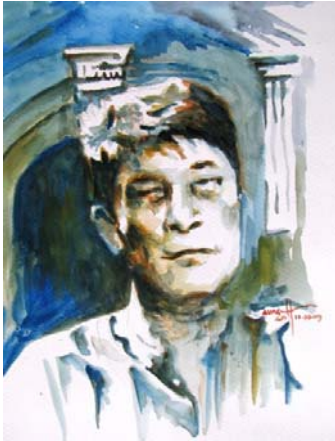
ဆရာမောင်သော်က

အဲဒီနေ့က ဒေါ်အောင်ဆန်းစုကြည် မြန်မာပြည်မှာ လူထုကို ပထမဆုံး မိန့်ခွန်းပြောတဲ့နေ့ပါပဲ။ ၁၉၈၈ ခုနှစ်၊ ဩဂုတ်လ ၂၄ ရက်။ နေရာက ရန်ကုန်ဆေးရုံကြီး နှလုံးရောဂါဆောင်ရွှေမှာ ဖြစ်ပါတယ်။